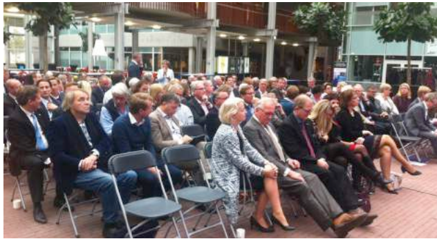
VVD leden tijdens ALV Regio Oost