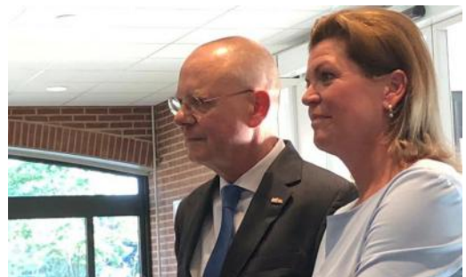
Aangetreden en vertrokken wethouder

“In al die jaren heb ik wethouders van dichtbij meegemaakt. Naar mijn mening heb ik een goed zicht op de inhoud van deze functie. Een mooie baan om zo voor Harderwijk en Hierden aan het werk te zijn, vooral omdat politiek en bestuur zo treffend bij elkaar komen. Zeker heb ik destijds wel eens nagedacht of het iets voor mij zou zijn. Maar ik moet eerlijk bekennen, dat ik gewoon te veel aan mijn eigen baan en niet in de laatste plaats aan Amsterdam bleek te zijn verknocht. En nu dient de kans zich aan om wethouder te worden. In alle eerlijkheid; ik vind het geweldig! Het was niet een droom, maar het is nu wel een fantastische kans. Enorm om na zo lange tijd bij de politie nu nog werk te maken van zo'n ongekende prachtige uitdaging!”