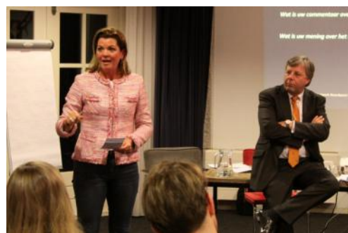
Nunspeet, 7 mei 2019 - VVD Partijvoorzitter Christianne van der Wal participeert in discussie over landelijke VVD politiek