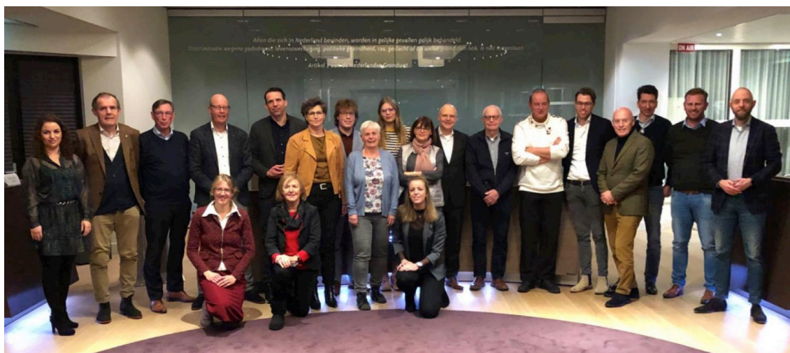
Deelnemers aan de debatavond op 26 november 2019 in raadszaal Harderwijk

Door het jaar heen hebben we werkbezoeken afgelegd. Onder andere bij Allinq, CBB en het Dolfinarium. We zijn volop in gesprek in de wijken en via social media. Hebben regelmatig inwoners op bezoek in de fractie en hebben zelf in het najaar een debatavond georganiseerd om te ervaren hoe het politieke werk eraan toegaat.