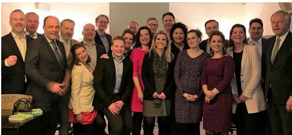
De Masterclass Regio Oost 2019 voor het laatst bijeen op het 'Diner Pensant', samen met VVD prominenten.

In 2019 mocht ik deelnemen aan de Masterclass van de regio Oost. Een fantastische ervaring die ik niet had willen missen! Een greep uit de thema's die aan bod kwamen: Presentatietechnieken, onderhandelen, integriteit, gemeentepolitiek en financiën, liberale loopbanen en mediatraining. Ik heb veel uit de trainingen gehaald, mede doordat ze gegeven werden door VVD'ers met uitgebreide ervaring in hun vakgebied. Veel link met de praktijk dus.