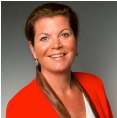
Partijvoorzitter Christianne van der Wal